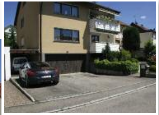
Wohnen und Arbeiten unter einem Dach: Das Haus wurde komplett modernisiert. Im Erdgeschoss befindet sich jetzt ein Institut für Kosmetik. Im OG liegt die Privatwohnung.

die Fassade des Hauses ein neues Gesicht – und der Balkon im Obergeschoss erstrahlt ebenfalls in neuem Glanz. Nachdem das gesamte Gebäude modern saniert wurde, durfte der Außenbereich nicht fehlen. Dieser erhielt neu gestaltete Wege und der Zugang zum Kosmetik-Institut überzeugt durch viel Grün sowie kleine Quellen und Lichteffekte.