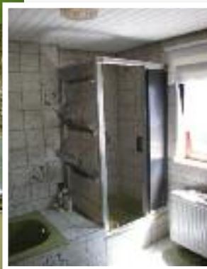
Die unterschiedlichen Zimmer des Hauses – wie hier im Bild das alte Bad – wurden zu Entspannungs- und Kosmetikräumen sowie zu einer Wellness-Oase umgebaut.