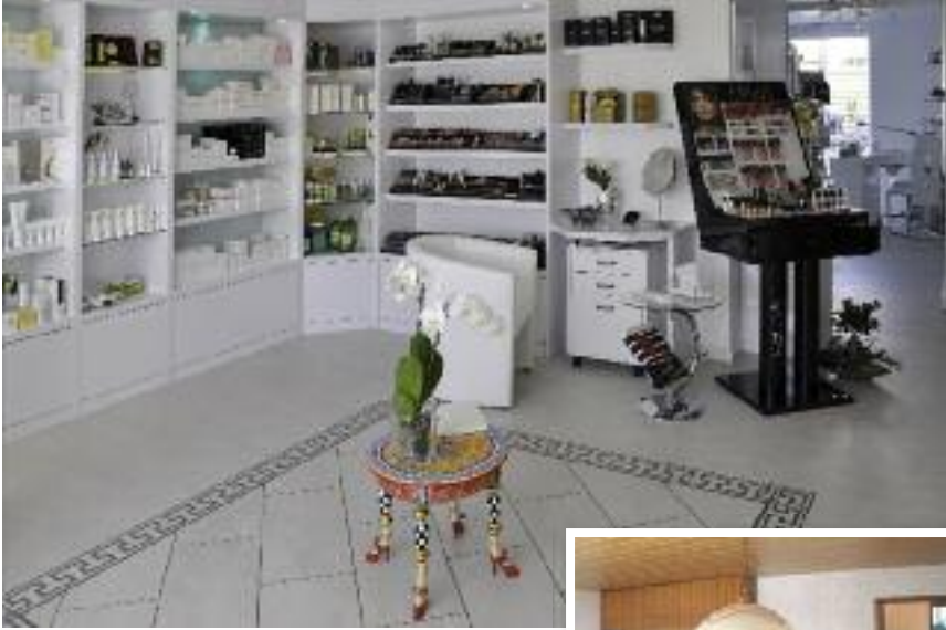
Das ehemalige, recht antiquiert anmutende Wohnzimmer kann sich nach der Renovierung sehen lassen: Es entstand ein attraktiver und moderner Verkaufsraum.